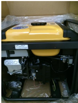
倉庫内（自家発電機）