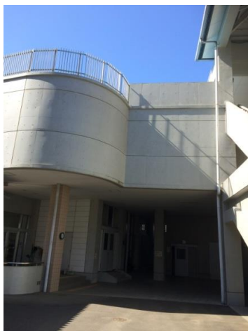
(機 械 室)

災害時にプールの水を濾過し ろか 飲用レベルの処理水として利用するためのシステムです。約1200名の全校生徒に対応するものです。