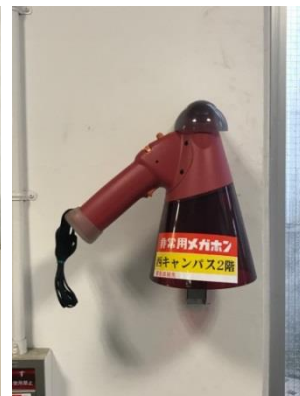
各キャンパスフロア（拡声器）