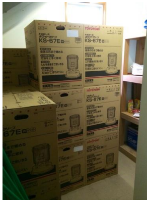
倉庫内（石油ストーブ）