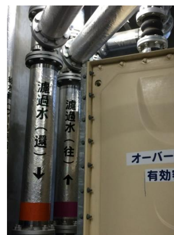
(緊急給水システム)