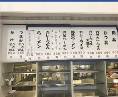
<アクティブラーニングによる「学食に関する調査」の様子です。>