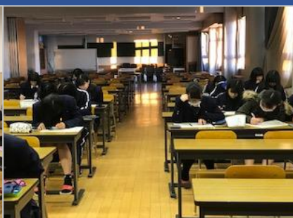
<課外補習の様子です！>