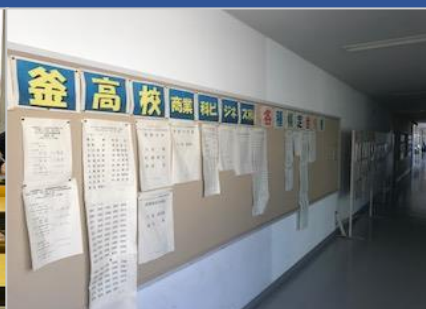
<検定試験の合格発表場所です>