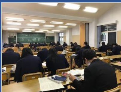
<簿記の授業の様子です>

商業科目では、検定資格の取得に努めます。1年生の内に「簿記」や「情報処理」の2級資格取得を目指した学習活動が行われます。