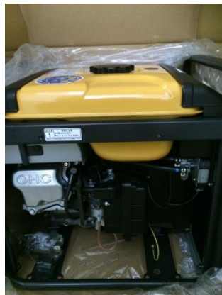
倉庫内（自家発電機：ガソリン用）