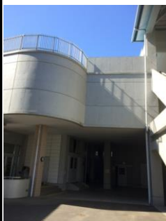
(機 械 室)