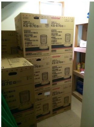
倉庫内（石油ストーブ）